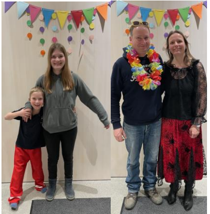
Die Party läuft