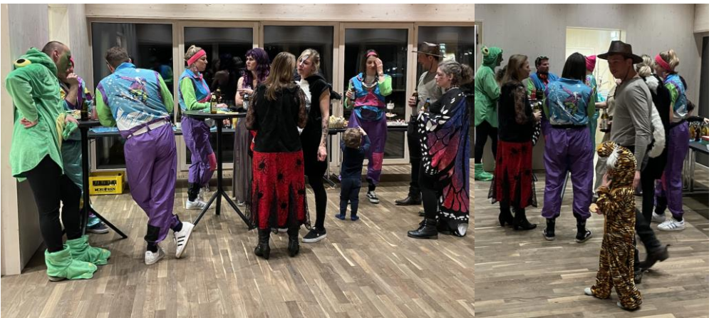
coole Typen in der Minibar