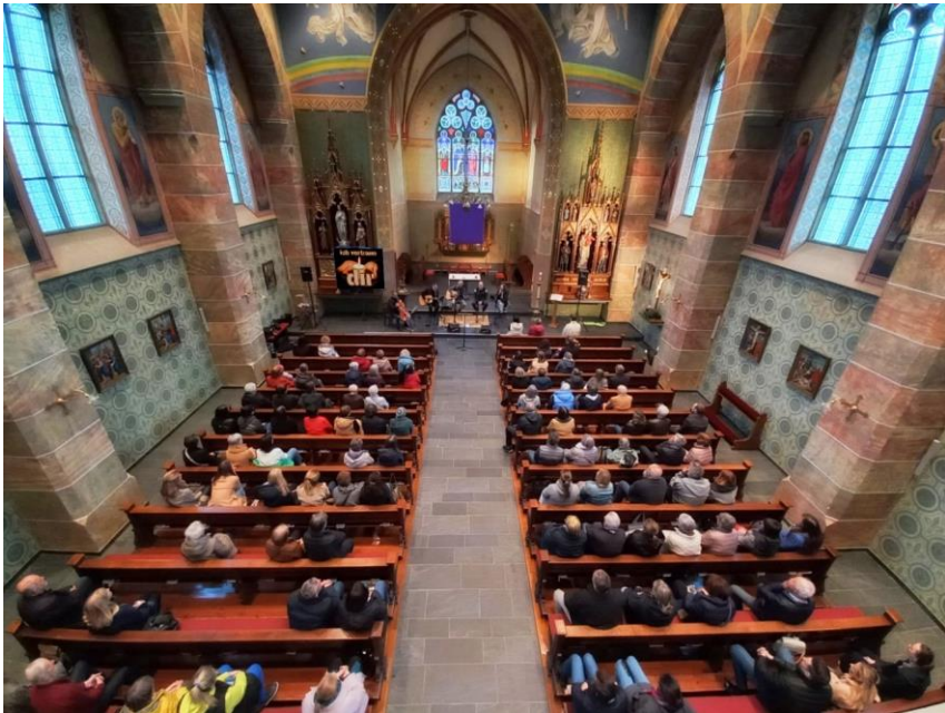
Reini Decker für das Segensfeier-Team