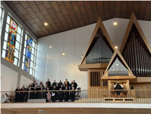
Patrozinium in Altach