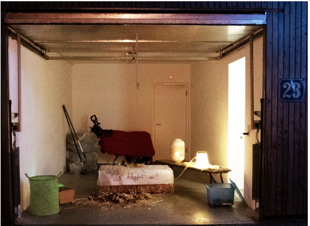
Im Stall bei Ochs und Esel....