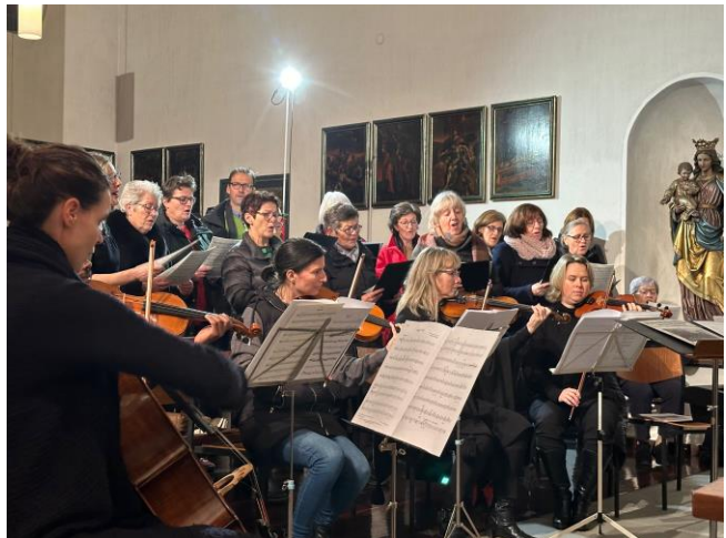
Hl. Abend in Röthis