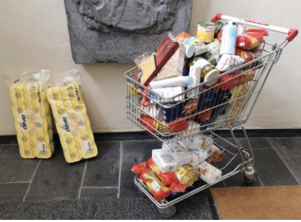
Voll gefüllt war der Einkaufswagen schon am Montag.